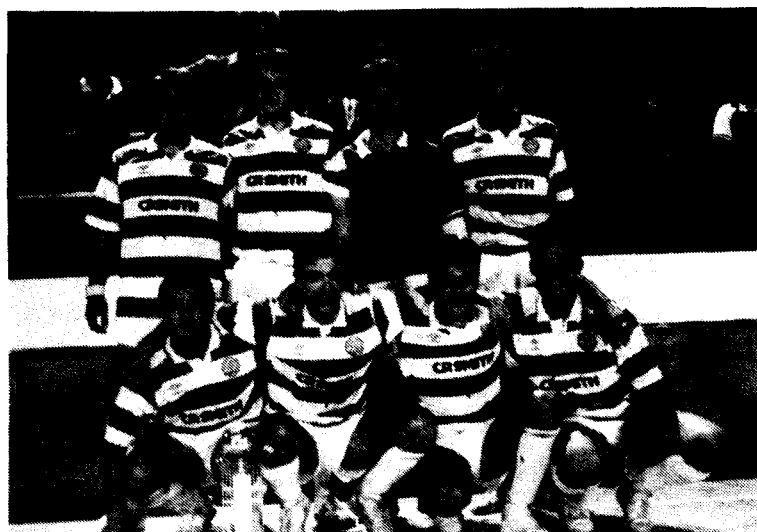
L'Esquella, equip campió.