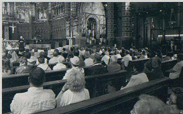
La benvinguda de Montserrat als pelegrins.