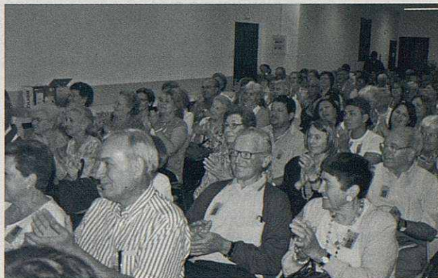
Instantània de la Sala on parlaven els testimonis de fe.