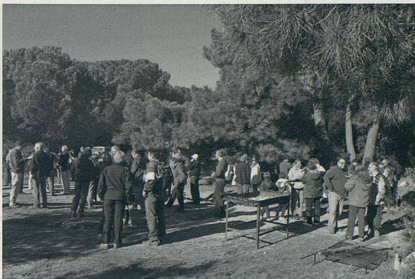
Esmorzats i a punt de tornar-hi. El dia hi va acompanyar.

Mitja part, hora de descansar i fer-la petar. Temps per esmorzar un bon pa