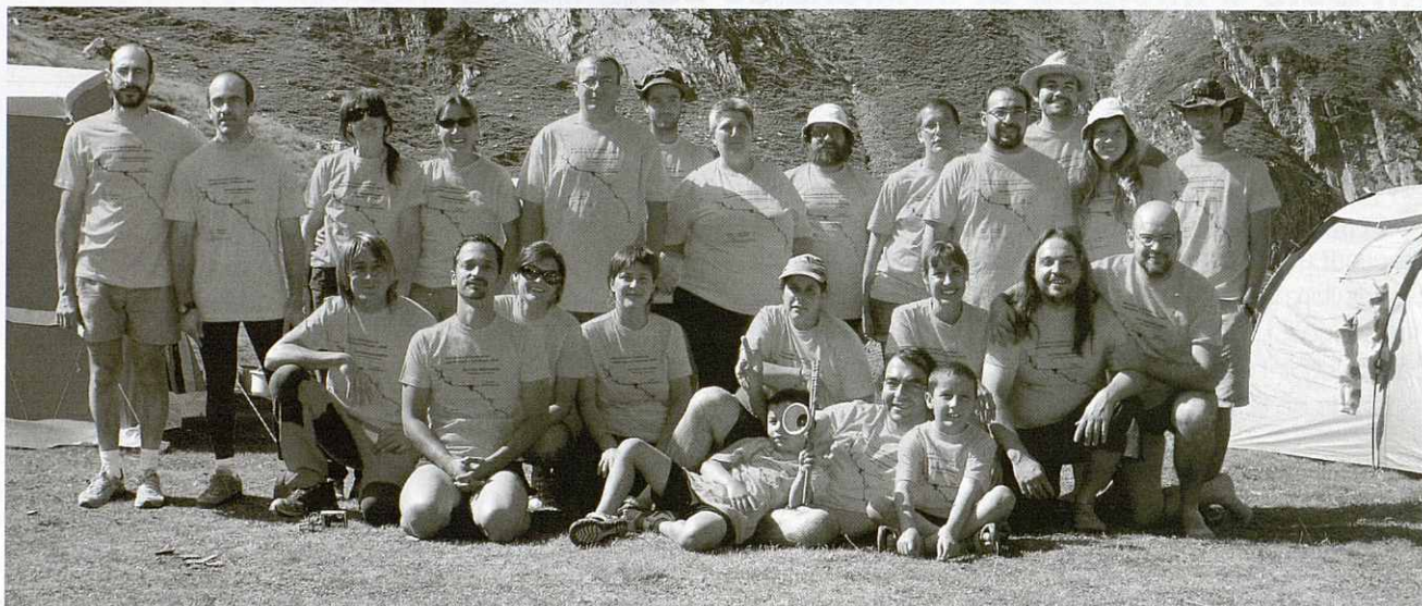
Vall d'Aran. Fotografia del grup; components del campament d'estiu amb membres del GIEG de Granollers i del EDES de Manresa

Una descoberta important de la campanya va ser la localització que vàrem fer, a finals del 2006, d'una cova a la Vall de Sarraera, on de moment, al llarg d'aquest any, s'han explorat i topografiat més de 500 metres de recorregut.