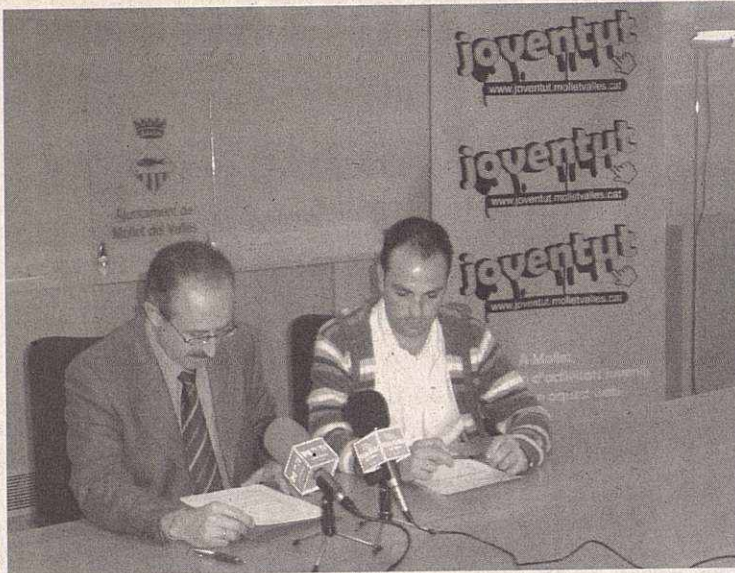
Momento de la presentación de la página web

www.joventut.molletvalles.cat es una página web dirigida al sector juvenil que nace con el objetivo de informar de todas las actividades organizadas para los jóvenes. Según Josep Monràs, alcalde de Mollet, esta página es "el primer producto de las peticiones realizadas por los jóvenes dentro del marco del Pla Jove aprobado en el pasado mes de enero". El concejal de Juventud, Dani Novo añadió que "los jóvenes pedían más comunicación e información sobre las actividades juveniles que ofrece la ciudad". El contenido de esta página está estructurado en un apartado inicial de presentación genérica con un calendario que hace de agenda de actividades. Esta parte genérica está reforzada con diversos blocs de diferentes programas dinamizados y promovidos por el Ayuntamiento, dirigidos a la población joven. También cuenta con un apartado destinado para las entidades y colectivos juveniles, donde pueden publicar las actividades que organicen y que estén dirigidas hacia la juventud. ■