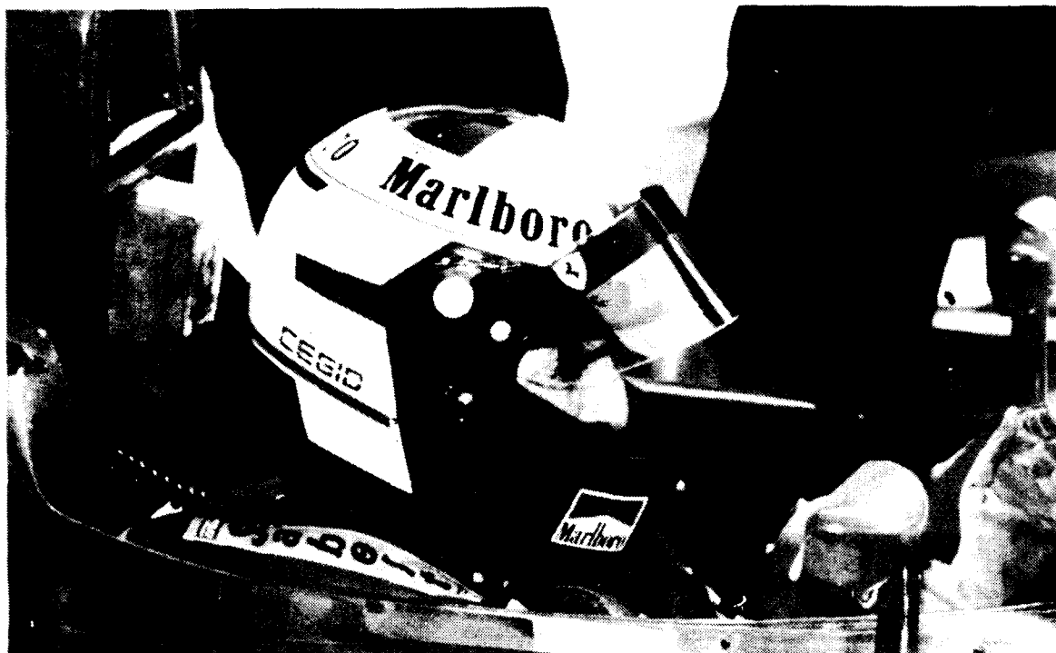
Alain Prost està demostrant que el seu fitxatge per Ferrari ha estat per treballar de valent i aconseguir la seva quarta corona mundial.

El campionat torna a estar obert i els dos homes Senna-Prost de nou lluitaran per aconseguir aquest campionat 1990, l'única diferència estriba en que un defensa els colors de McLaren Honda i Prost els colors de Ferrari. Les espases esten de nou enlairades i després de cobrir-se la meitat del campionat no hi ha cap altre pilot ni escuderia que pugui optar al títol.