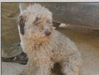
Cruce gos d'atura macho, 18 meses