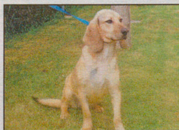
Cazador hembra, 18 meses