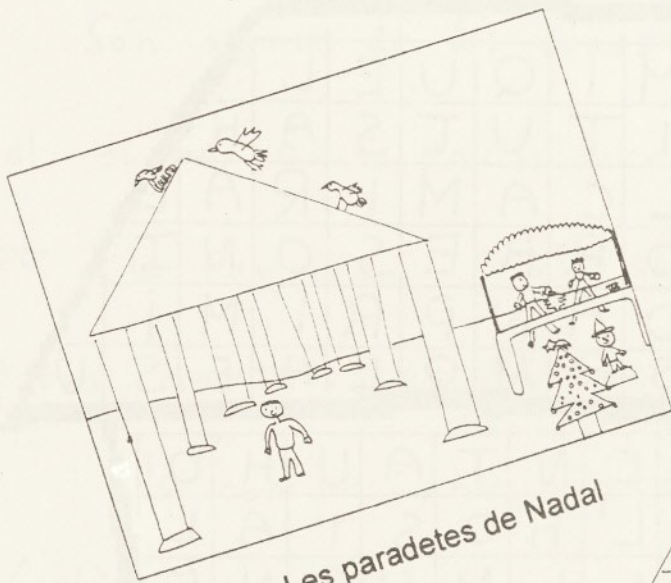
Les paradetes de Nadal

Les últimes obres de la Parxada es van acabar l'any 1984 i és tal com la veiem actualment.