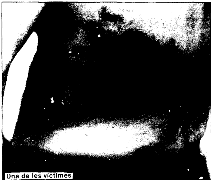
Una de les víctimes

D'altra banda es pot demostrar que els que irromperen amb violència en el local foren els policies, ja que una emissora local ho va transmetre mitjançant una trucada que un dels tancats fora en entrar la policia al local, durant els primers minuts es van poder sentir els crits i cops que feien els policies.