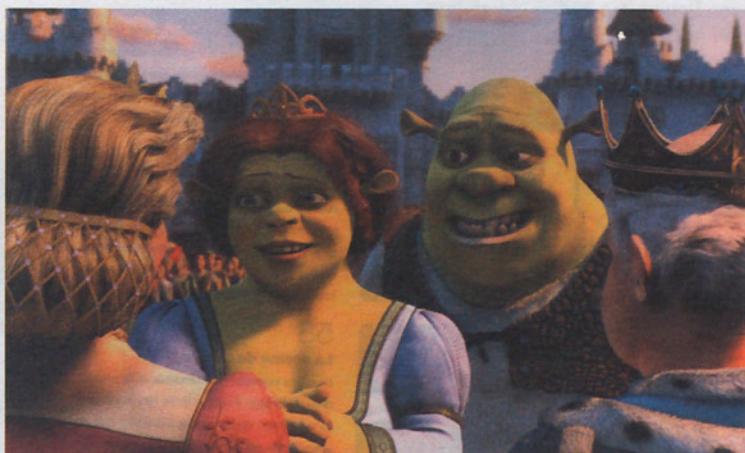
Shrek , lo más comercial.

Maresme y poblaciones cercanas, al surgir ofertas en aquellas zonas, aquellos visitantes se han volatilizado. Y al fin y al cabo, las programaciones y los estrenos son similares y al unísono.