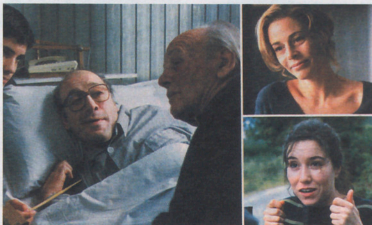
Mar adentro , lo mejor del año.

Si desde 2001, año del récord en Catalunya, se ha pasado de 31,86 millones de espectadores anuales a los 28,70 millones de 2004, con una caída del 10% o lo que es lo mismo la pérdida de 3 millones de espectadores. En Granollers este porcentaje ha sido superior, pues si en los primeros años acudían espectadores de Osona, Mollet,