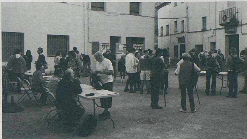
La plaça de Riells oferia aquest magnífic aspecte a l'hora de les inscripcions.

amunt entre el que havien sigut feixes limitades pels marges de pedra seca que encara es poden observar. El grau de l'Uià és el pas que va permetre superar l'últim tros de paret vertical del cingle. A dalt de la cinglera es va seguir cap a la casa de l'Uià on hi havia un control que proporcionava fruita i aigua als participants després del fort desnivell de pujada. Es continuava pel GR5, i després de travessar el torrent es pujava cap a les runes de la casa de la Serra. A partir d'aquí el camí anava amunt per la pista que segueix la carena deixant a la dreta el Puig Descalç cap a Can Magre, Sant Pere de Bertí i finalment es va arribar al Clascar on hi havia l'esmorzar, una botifarra ben merescuda. El recorregut ens va portar sobre el Grau de Montmany amb vistes cap a la vessant del Congost i seguint per sobre la cinglera donant