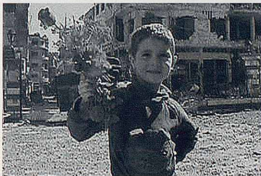
Fotograma del film SYRIA SELF PORTRAIT.

Nadal! Bones festes! Bon solstici d'hivern! —a triar—. Posats a la taula oblidarem els pobres —i tan pobres com som— Jesús ja serà nat.