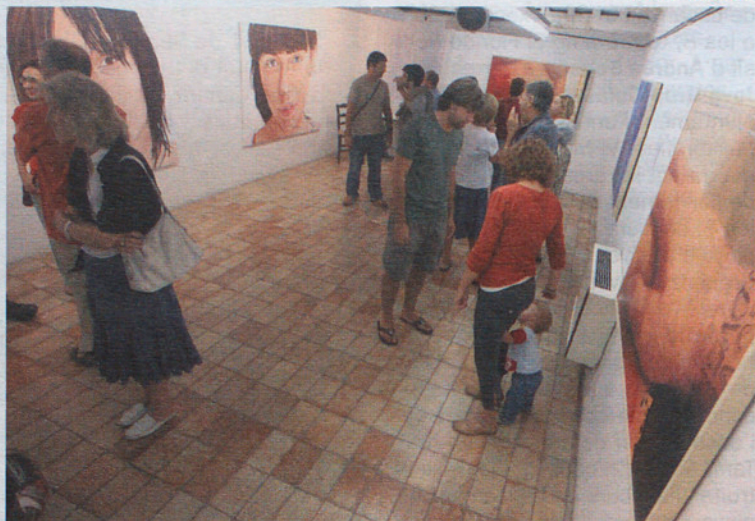
Diferents artistes i estils a les sales B i C.