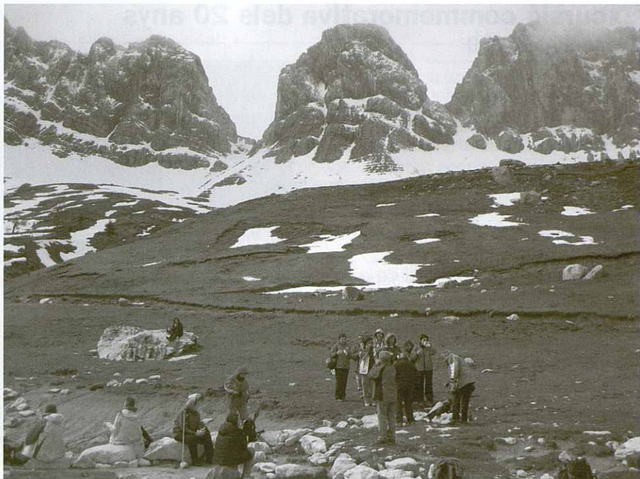
Al centre, la Punta del Achar. A l'esquerra El Achar de Alano o Paso de Taxares.

El sopar l'efectuem en un restaurant del poble i un cop acabat anem als nostres punts de descans respectius.