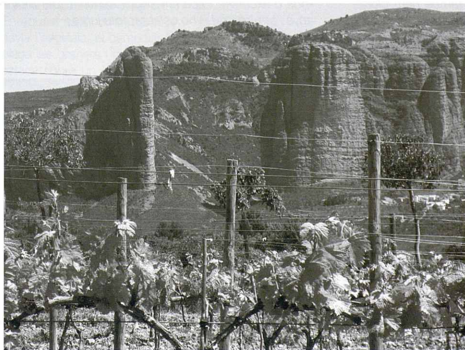
Riglos de la finca del "Reino de los Mallos".