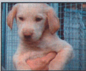
Cruce Labrador Macho 2 meses