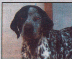
Cruce Dálmata macho 2 años