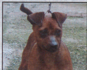
Pinscher macho i año