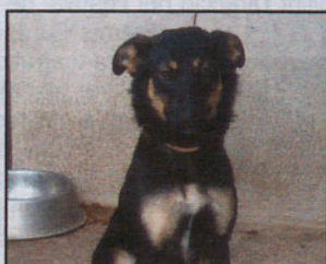
Mestiza hembra 10 meses