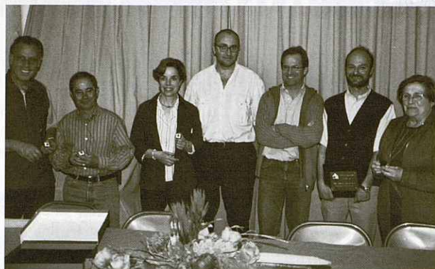
Instantània dels guardonats durant la Diada Social de l'AEG