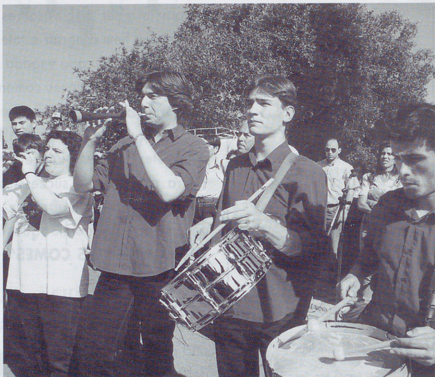
Els grallers. Que bé que toquen!

És trist haver de començar un article amb aquest títol, però és una crua realitat que vivim en el món casteller. Després de dos anys d'estar a la colla castellera, t'emociones quan veus que comences a pujar, però llavors: la decepció! Un dia -no saps per què- tornes a fer de tapaforat, perquè és així com ens diuen. No és que no ens agradi la nostra funció de falques, però era més emocionant i "menys depreciatiu" ser a dalt. A l'hora de cantar la pinya: com si no hi fóssim. Ens estem plantejant de fer vaga perquè -encara que no ho semblis- un element essencial dins la colla, i la majoria dels que "petxuguem" aquí de metre seixanta som d'aquest rang. No ens agrada