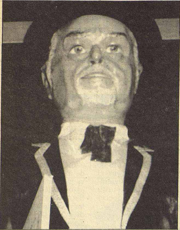
El «gegant» de l'Abelló constituí la nota insòlita de la seva exposició antològica, causant l'admiració dels vianants que passaven per davant de la Diagonal, núm. 612, en quin quart pis hi té la seva seu el Fons Internacional de Pintura