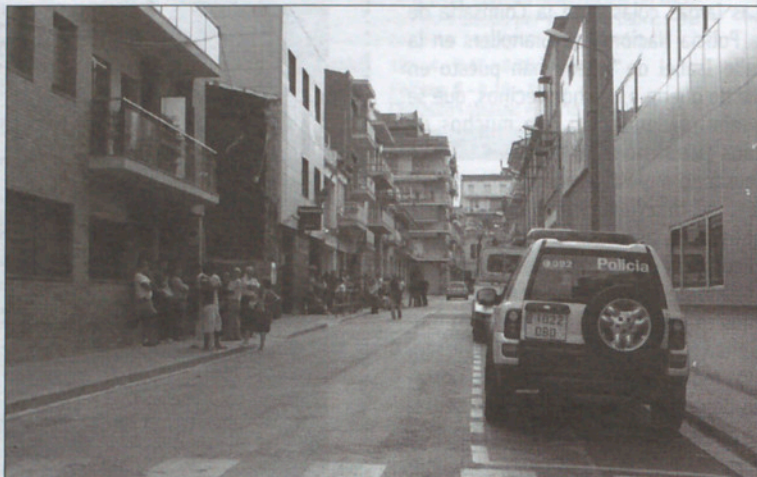
En la calle Isabel de Villena coinciden la Comisaría de la Policía Nacional y la de la Policía Local.