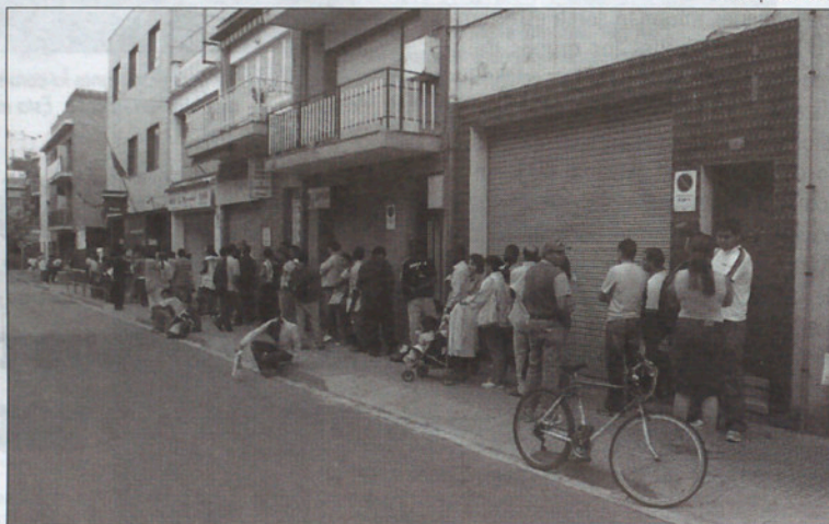
La tramitación de la documentación de las Tarjetas de Residencia es de las más solicitadas.

no está exenta, afirman otras personas, de situaciones que ellos no pueden ratificar pero que adivinan y que podrían darse, entre ellas la posibilidad de que haya grupos que intenten sacar beneficios con el hecho de guardar la tanda de llegada para entrar en comisaría, ya que según ellos, "no resultaría extraño que compraran los turnos". Las conversaciones en voz alta que estos días de verano resuenan notablemente más en cada esquina, algunas broncas verbales y otras consecuencias, entre las que destacan las manchas causadas en algunas paredes, han puesto poco más que en pie de guerra a unos vecinos que han visto alterada, según ellos, su vida "con una gran pérdida de calidad".