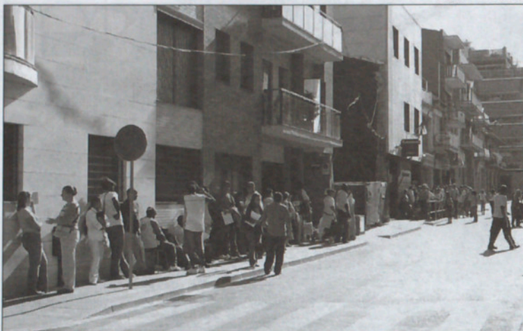
La presencia de estas personas en la calle molesta a los vecinos de la zona.