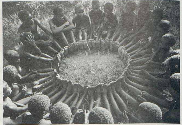
Per educar un sol infant cal tota la tribu.

A final de curs, quan el club de torn guanya la copa del no sé què, pregunto als meus alumnes més fanàtics del futbol, de què serveix guanyar. La majo-