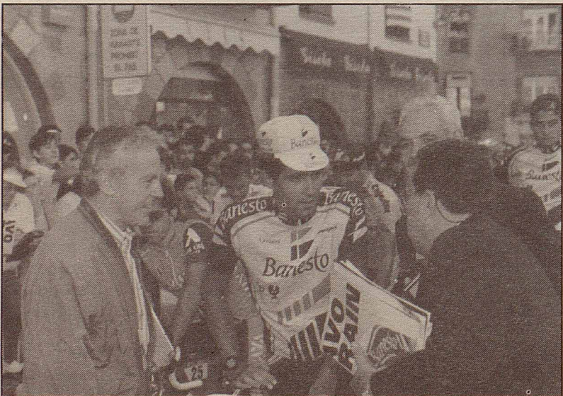
4 Miguel Induráin pocs instants abans de la sortida amb els presidents dels tres clubs ciclistes que van col·laborar a preparar l'etapa