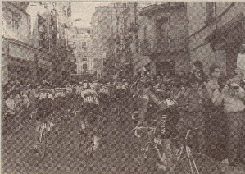
La gent va voler acostar-se al màxim per veure les primeres figures del ciclisme mundial