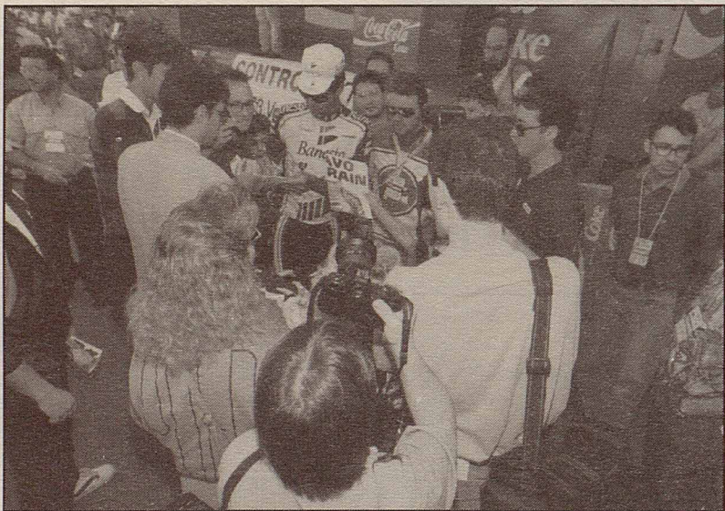
Miguel Induráin envoltat d'aficionats de mitjans de comunicació. El palmarès del corredor del Banesto justifica l'expectació