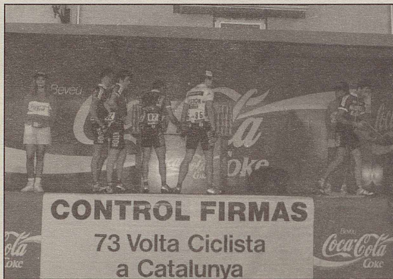
Els corredors passen el control de signatures abans de començar l'etapa