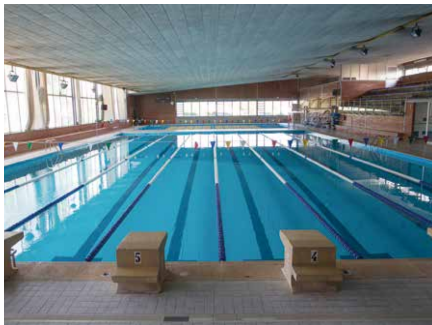
Piscines municipals de Granollers

El pressupost municipal del 2021 és també un pressupost inversor. S'inverteix en obra pública ja que aquesta, a més de millorar la ciutat, serà