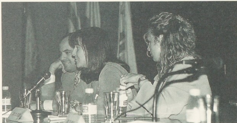
Trobada d'Hospitals Comarcals sobre la sida.