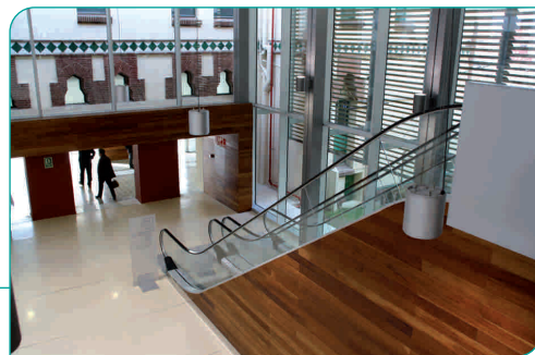
Imatge de les escales que pugen a la primera planta del nou edifici

-Al segon soterrani es troba la galeria d'instal·lacions que connecta el nou edifici amb l'edifici industrial. Al terrat de l'edifici s'ubiquen les instal·lacions de climatització.