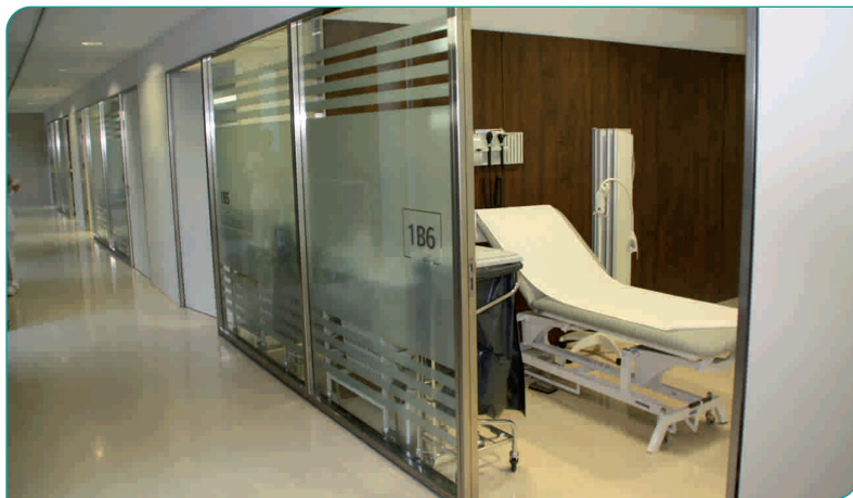
Un dels 76 nous consultoris

Els colors només han estat emprats en les parts públiques per tal de fer més fàcil l'accés als consultoris. Tot i així, tots els espais del nou edifici estan identificats amb una placa que indica el número de planta, la zona i el número de consultori: per ex., 1B06 vol dir que es tracta de la 1a planta, zona B (color verd) i el consultori núm. 6.