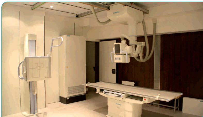
Nova sala de raigs X