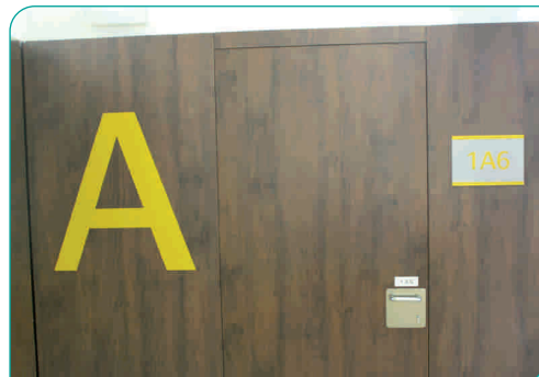
Les portes dels consultoris també estan degudament identificades