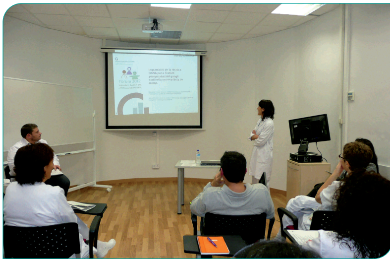
La Marató científica va comptar amb la participació de més de cent professionals

El passat 23 de novembre l'Hospital General de Granollers va celebrar el Fòrum 2012 sobre Seguretat i Qualitat per a Professionals i Usuaris amb l'objectiu de promoure la participació dels professionals en diferents activitats científiques i socioculturals i també la dels usuaris i ciutadans de Granollers, per donar-los a conèixer l'Hospital i convidar-los a intercanviar experiències.