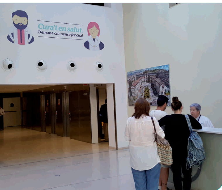
Rètol informatiu de la campanya situat al vestíbul de consultes externes

El passat mes de juny, l'Hospital General de Granollers va posar en marxa un nou sistema de sol·licitud de visites per a les persones usuàries del centre. Aquest nou sistema té com a objectiu agilitzar el tràmit administratiu de citació de visites successives i que no sigui necessari passar pels taulells d'atenció ambulatoria i proves, fet que sovint comporta haver de fer una cua.