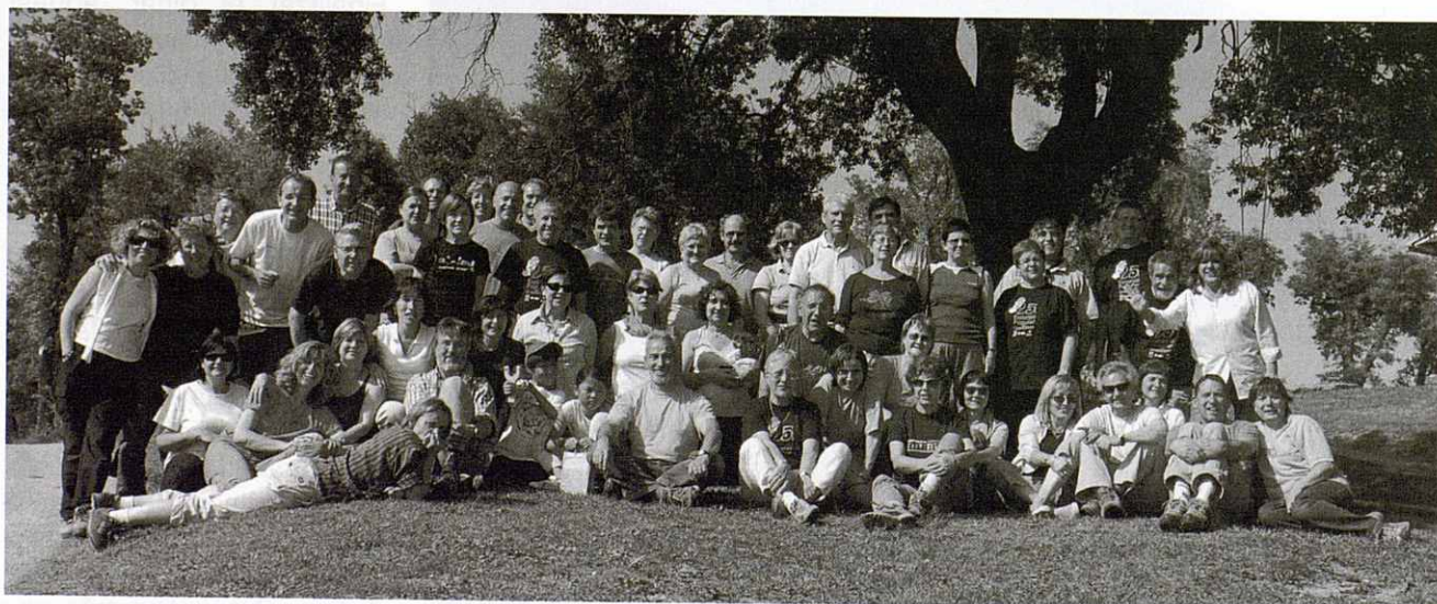
El grup del 20è. Aniversari. I molts més, no no van poder anar a celebrar-ho.