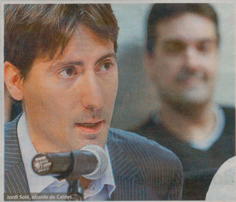
Jordi Solé, alcalde de Caldes.

REDACCIÓN | El alcalde de Caldes y diputado en el Parlament de Catalunya, Jordi Solé , aprovechó el último pleno municipal para ajustar el cartapacio municipal a la nueva situación. Como diputado debe dedicar más tiempo al Parlament y menos al Ayuntamiento, pero además ahora ya no cobrará su sueldo (52.253 euros) de las arcas locales, sino que pasará a percibir el sueldo que se le ha asignado como parlamentario. Esto le permite redistribuir estos recursos – en forma de responsabilidades y dedicaciones – entre los miembros de su equipo.