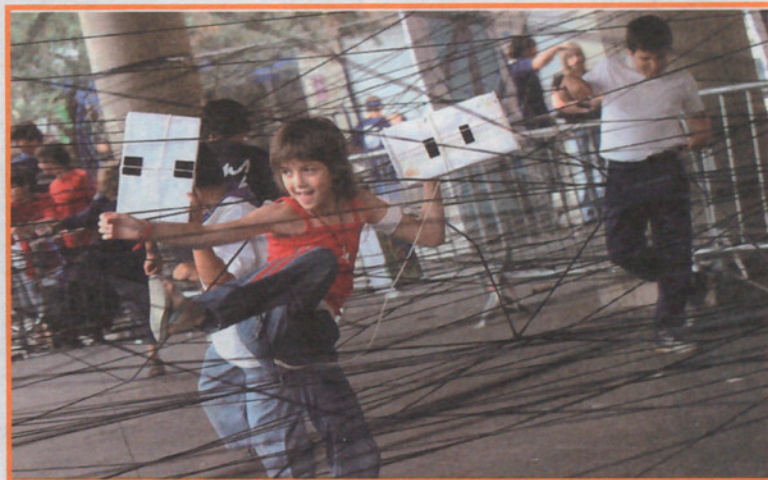
Atrapasomnis de los Blaus.