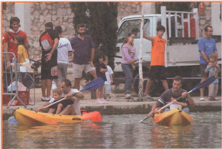
La Agrupación Excursionista ofreció su especial ruta de aventura.