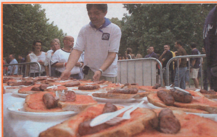
Butifarrada para reponer fuerzas.