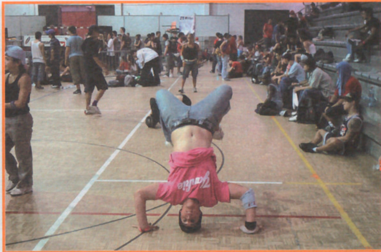
Campeonato de Break en el Pabellón.