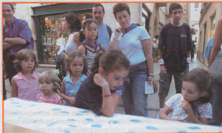
Ai quin mal, em sortirà un Blau!