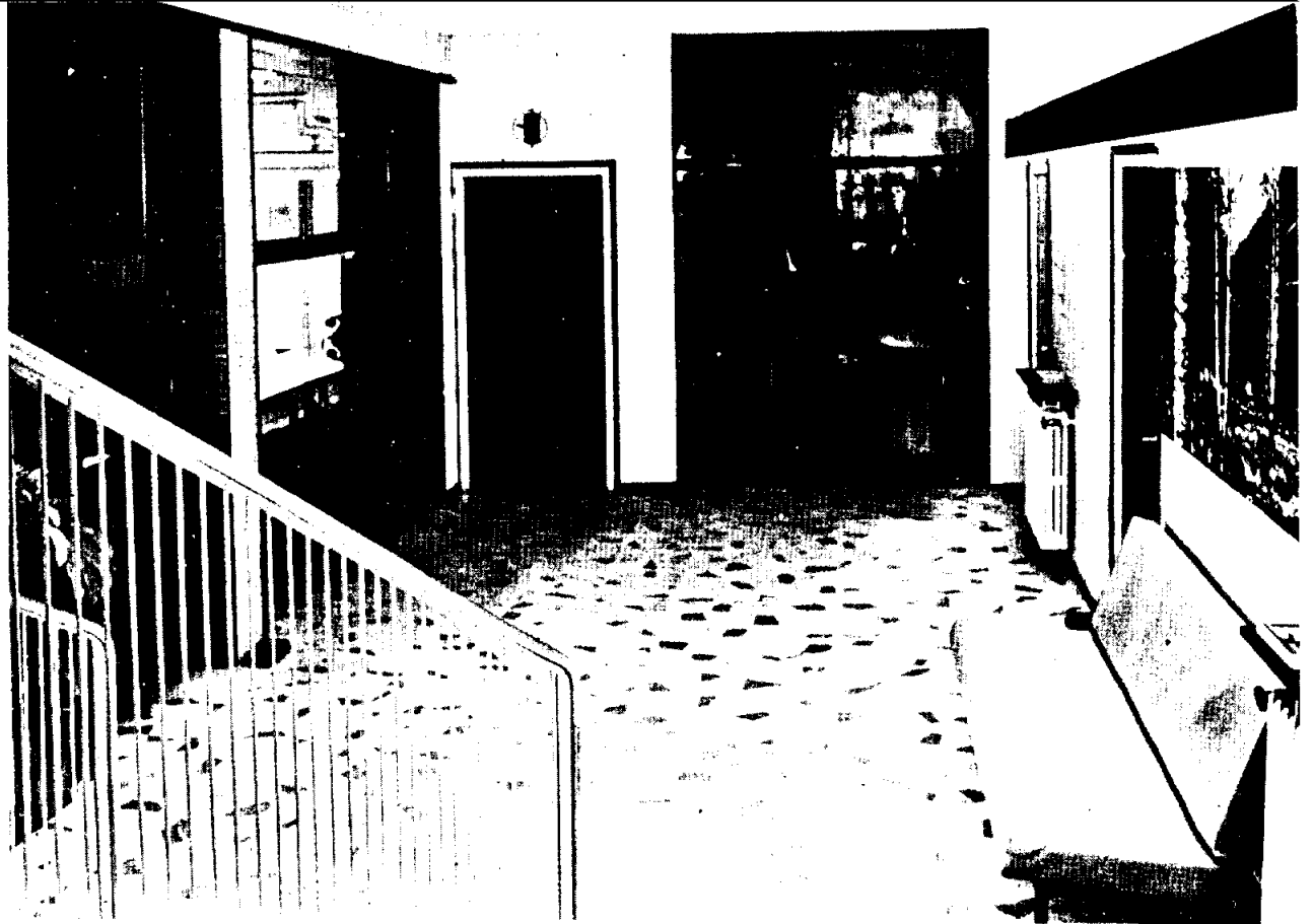
Entrada del antiguo Ambulatorio de la Mutua del Carmen, con el mostrador.