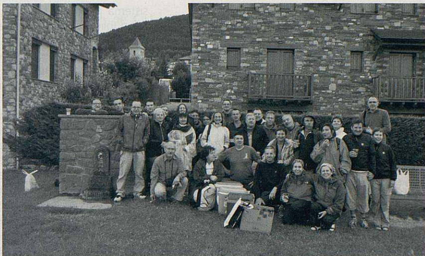
Aquí teniu la major part dels intrèpids caminaires, poc després de dinar. Quan èrem al cim del Puigmal, no estavem per fotos.

Les prediccions meteorològiques pronosticaven mal temps pel primer diumenge de juliol, quasi sempre l'encerten i aquesta vegada no podien ser menys. Vam fer tota la pujada tranquil·lament, però a l'arribar a la carena, al coll del pic del