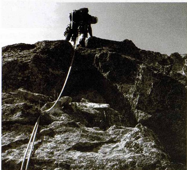
Últim llarg de l'Esperó dels Cremasants, Cavallers.

Però el curs no finalitza aquí, degut a l'interès mostrat pels cursetistes, confeccionem amb ells un petit calendari de sortides post-curset per tal de continuar guanyant experiència a la muntanya. El 29 i 30 d'abril pugem al Posets des de Viadós. Fem una sortida combinada amb gent del curs de muntanya, mentre ells arriben al cim per la ruta normal, nosaltres pugem per la canal Jean Arlaud, no cal dir que els ressalts de gel els hi toca obrir als cursetistes, i donades les circumstàncies els hi hem de posar un deu.