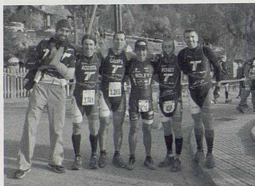
Els nostres corredors a Vallfogona del Ripollès.