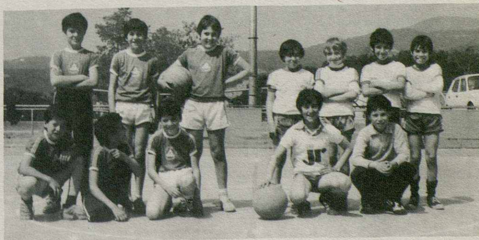
SAN LUIS GONZAGA