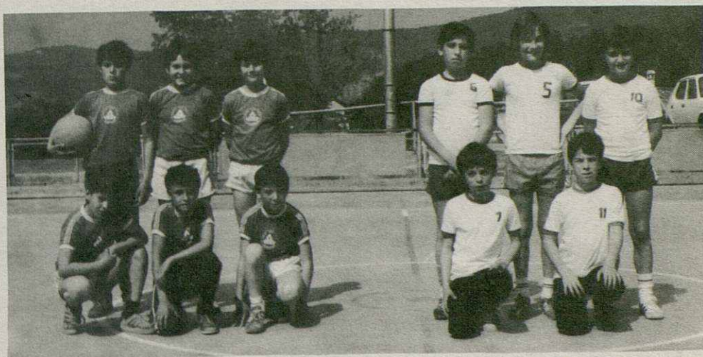
SAN LUIS GONZAGA