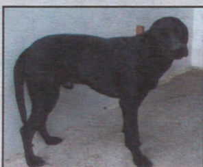
Cruce labrador macho 18 meses