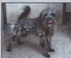
Cruce macho 24 meses