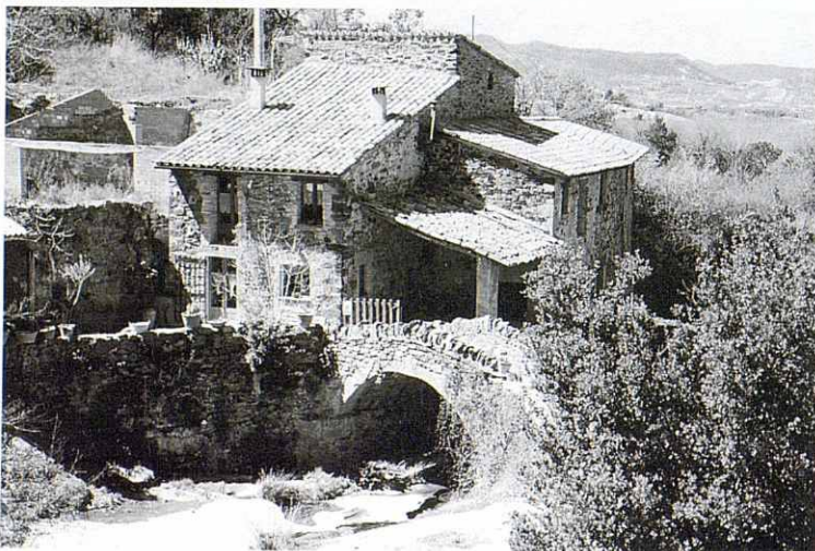
Molí dels Capellans.

Té gravat "MORS 99 MCS". Recorda una batalla entre la gent del país realistes i els miquelets o constitucionals. Segons la tradició mataren 99 miquelets i els enterraren en una feixa propera, dita encara "la feixa dels morts". Creuem la carretera que va de Taradell a Viladrau i el torrent de Masgrau, molt aprop passem pel costat de la font de Masgrau, que deu ser, per la seva bellesa, una de les més visitades del municipi; aquí prenem un corriol amb trams de forta pujada fins arribar al castell de Taradell o de can Boix, a 803 metres d'alt, situat sobre uns penyals de roca. Fou el centre jurisdiccional d'un ample territori (documentat). Des del 893 es conserven importants runes, més enllà arribem al coll de Taradell, enllacem amb el GR-2 que seguirem en direcció a Aiguafreda, des d'aquí tenim àmplies vistes sobre la plana