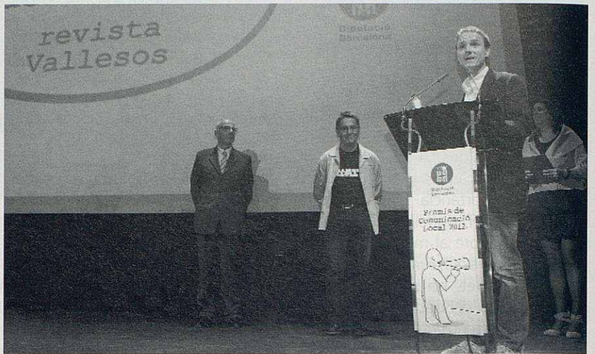
Acte de lliurament dels Premis de Comunicació 2012.

És evident que el guardó aconseguit representa per a Vallesos una enorme satisfacció i esdevé un reconeixement explícit a la feina que encapça-