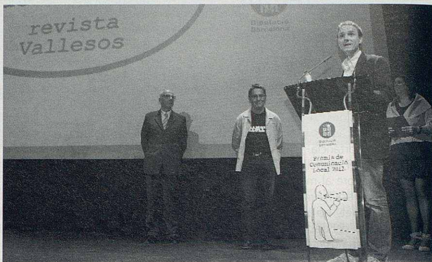
Acte de lliurament dels Premis de Comunicació 2012.

És evident que el guardó aconseguit representa per a Vallesos una enorme satisfacció i esdevé un reconeixement explícit a la feina que encapça-