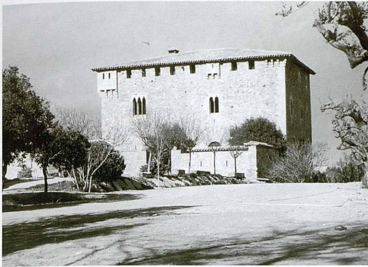
Casal de Mont-rodon.

d'Osona i al fons els Pirineus. Deixem el GR-2 per continuar pel sender, passem al costat d'un sepulcre de fossa, més endavant passem a prop de can Gasala i després pel Molí de Sorts, creuant per aquest indret, el Gurri; passem pel costat de la casa Nova; tot seguit creuem la carretera de Balenyà a Taradell, agafem el camí del casal de Mont-rodon, del qual passem molt a prop. Aquest casal és una casa forta medieval amb elements romànics del segle XII, amb interessants finestrals gòtics. Continuem en direcció al collet de l'Espanya on seguirem cap a l'esquerra, vistes del pla de Mont-rodon. El Puig, masia documentada el segle XI, antigament una de les masies més importants del terme. Abans d'arribar a la masia agafem camí de baixada a la nostra dreta i arribem al punt inicial.