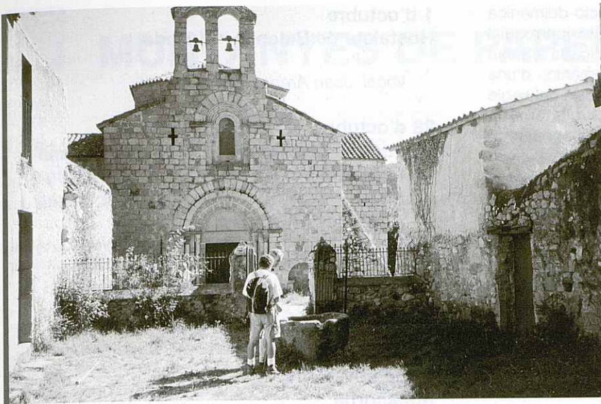
Sant Pere Cercada.