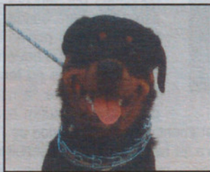
Rottweiler macho 1 año