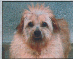
Cruce Macho 4 años