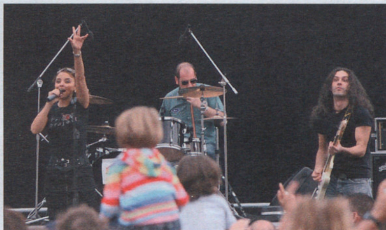
Una de las actividades paralelas fuera de pista fue el concierto de Chenoa.

El DTM, repleto de actividades paralelas, reúne a cerca de 36.000 espectadores durante el fin de semana