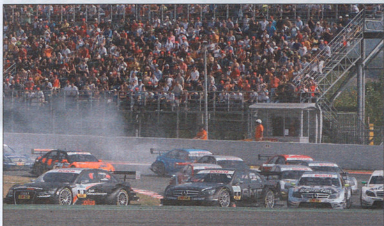
La salida del DTM, como siempre, espectacular.