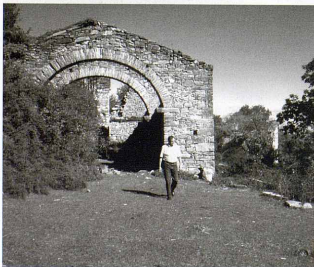
Antiga masia de les Artigues, avui en estat ruïnós.

Itinerari circular (GR-3 fins el Puig de l'Obiol). Iniciem el recorregut en el nucli antic de Vallfogona a 928 m. alt., nucli que encara conserva un dels portals de l'antiga muralla, a la part més alta es troba el castell de la Sala, construït per la família Milany després d'abandonar el castell de dalt la Serra, sortim per la plaça de la vila en direcció Sud a pocs metres trobem el GR-3, sender que ens portarà cap al castell de Milany, creuem la riera de Vallfogona, pel pont Medieval, aquí iniciem la pujada per entre prats i boscos de pins que més endavant amb l'alçada seran de faig i amb un sota bosc de boix, passem pel costat de les antigues