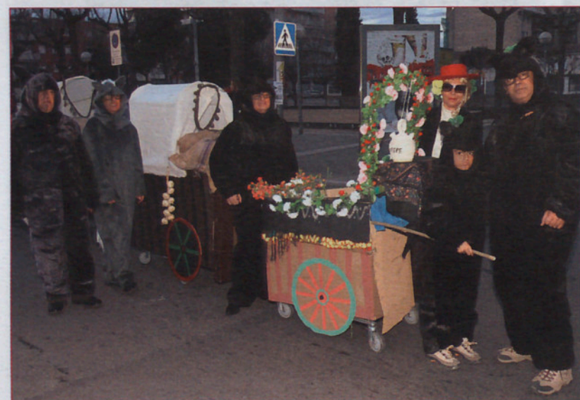
LOS ANIMALES, CARRUAJES... Desde el barrio Sota el Camí Ral de Granollers, revivieron algunos momentos de la Desfilada de l'Ascensió. La cosa mereció premio por parte del jurado.