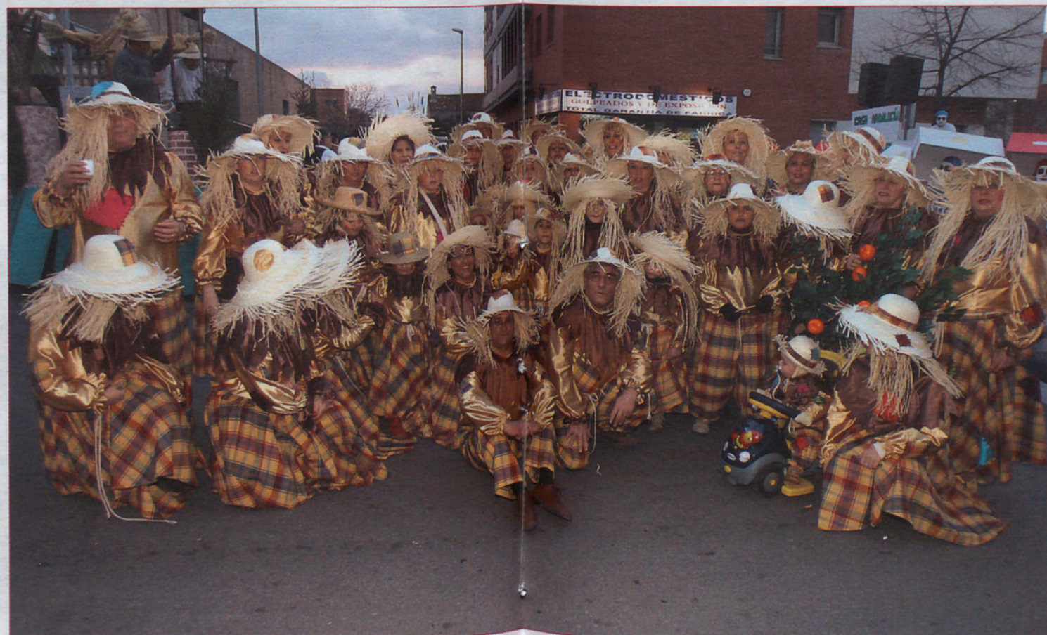
LOS DEL HOGAR EXTREMEÑO DE CANOVELLES, SIEMPRE EXCELENTES. Son de los grupos que, año tras año, se curran la comparsa y este año, cual labriegos del campo, se pusieron sus mejores galas de trabajo y... a la calle. Uno de los premios, fue para ellos y con todo el merecimiento del mundo.