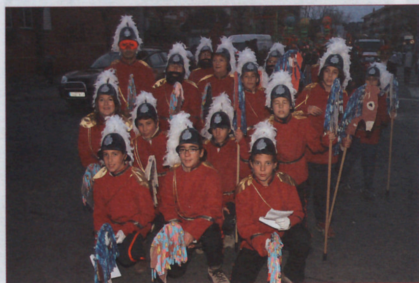
LA GUARDIA MONTADA A CABALLO DEL BARRIO SOTA EL CAMÍ RAL. En realidad, todos sabemos que la Guardia Urbana montada a caballo ya no participa en la Passada de l'Ascensió de Granollers, pero fueron recordados...