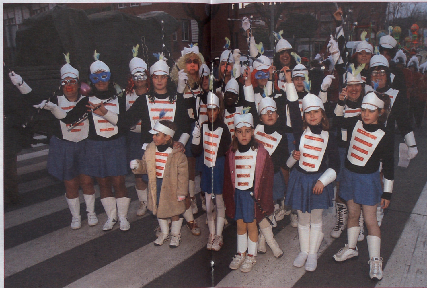
Y LAS MAJORETS... Dicen que dicen, que durante unos años, fueron el más vistoso del Desfile de la Ascensión. El domingo volvieron de nuevo a hacer los correspondientes ensayos por la calle Mayor y no lo hicieron de todo mal.