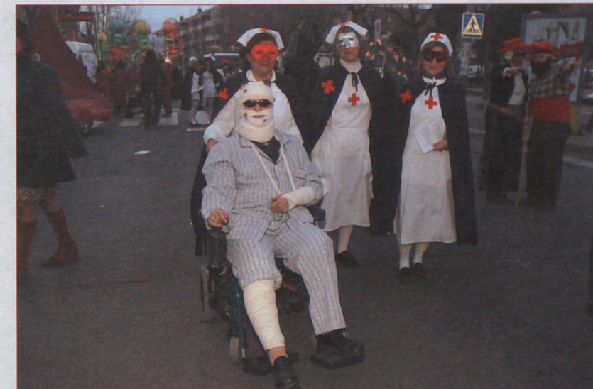
LAS CHICAS DE LA CRUZ ROJA. En los desfiles de la época más exitosa de la Ascensión no faltaban nunca las chicas de la Cruz Roja, dispuestas para todo. El domingo salieron con las carrozas y tuvieron bastante trabajo.