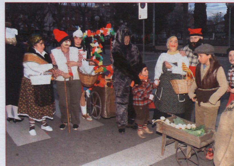
Y NO PODÍAN FALTAR LOS PAYESES... Tiempos pasados otrora famosos y hoy... material de pandereta de una rua que vio en este tema un filón para hacerse con uno de los premios. ¡Quina passada de Passada!