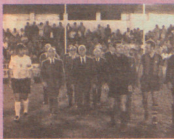
Vallés nº 1895 5/9/1972