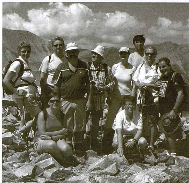
Els membres del grup al cim del Pic de la Dona.

Baixem ràpidament cap al Clot de la Regalíssia i per una de les pistes d'esquí, en una mica mes d'una