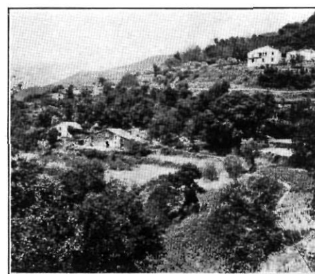
A les proximitats del poble de Montseny, les cases de pagès, escalonades entre les feixes de conreu...

A baix de la fondalada la convicció de la insignificància humana i l'eco que ressona enclòs dins del torrent fa tremolar la