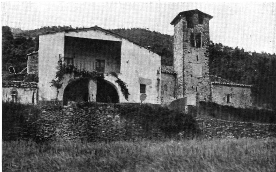
Cap a La Castanya i a l'ombra del vell campanar romànic...