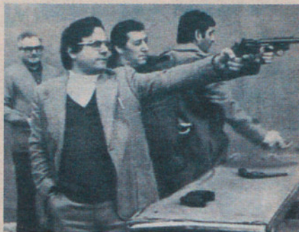
21/2/1978 Revista del Vallés

“La Federación Local de Tiro Olímpico Español de Granollers, que ha venido desarrollando sus actividades de la creación en 1975, fecha que fue aprobada por la antigua Delegación Nacional de Deportes, abre su campo de acción a nuevos horizontes en esta disciplina olímpica. En este sentido acaban de dar comienzo los trabajos de acondicionamiento de un polígono de tiro en el Club Belulla, donde serán dispuestos un total de 21 puestos de tirador, para la práctica de cinco disciplinas dentro de las distancias de 25 y 50 metros”.