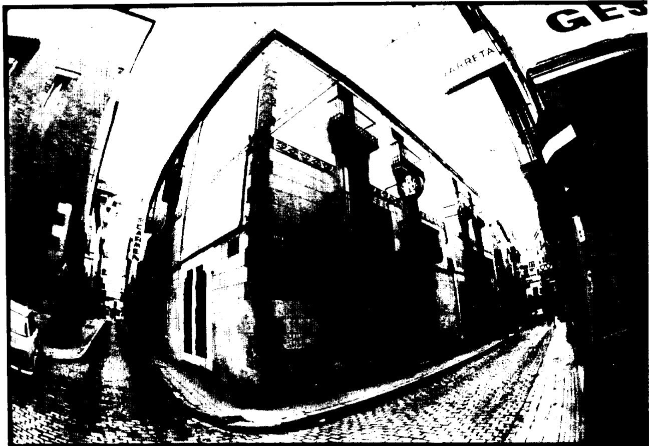
Curiosa fotografia del Ambulatorio de la calle Santa Elisabet.